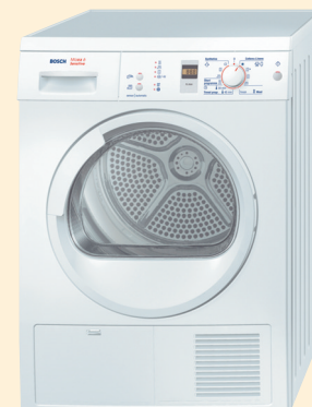
WTE 86300 BY