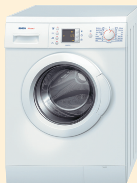
WAE 2444 OE