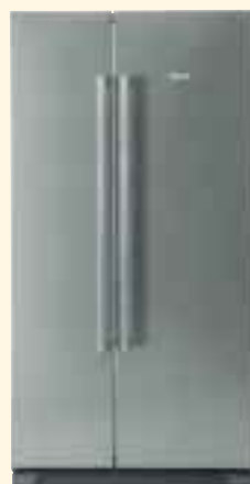
KAN 56V40 цвет нерж. сталь KAN 56V50 черный