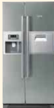
KAN 60A40 цвет нерж. сталь

• Система NoFrost • Класс энергопотребления: «А» • Раздельное электронное управление • Внутреннее освещение в холодильном и морозильном отделениях • 1 компрессор • Уровень шума: 45 дБ