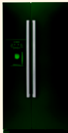
KAN 58A50 черный KAN 58A40 цвет нерж. сталь KAN 58A10 белый